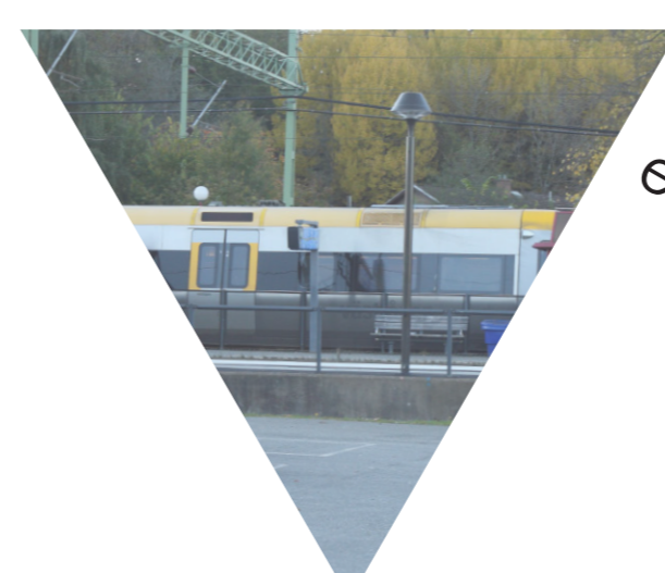
Tågspåret bildar en barriär