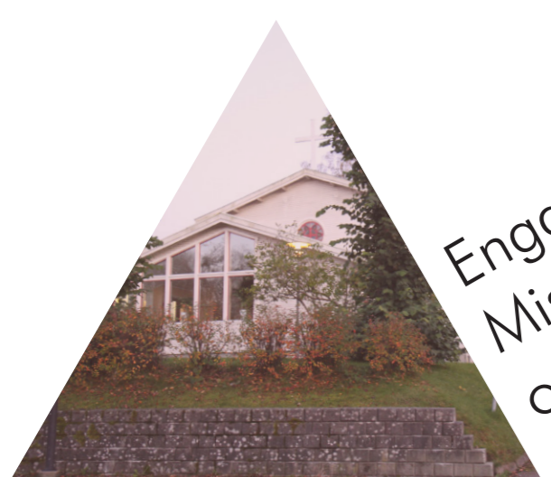
Engagemang i Missionskyrkan och andra föreningar