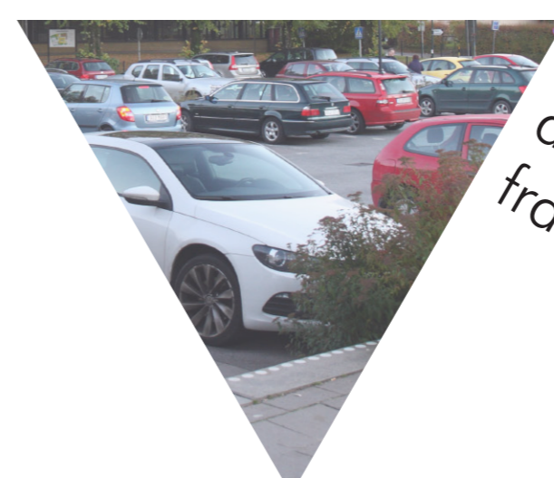
Den stora parkeringen är idag Flodas framsida