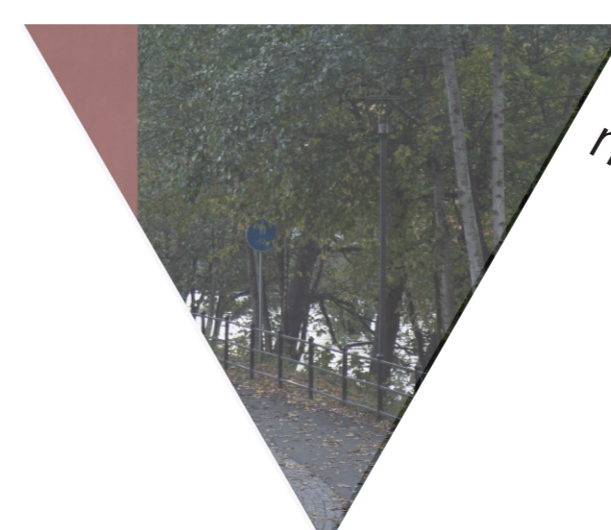
Dålig kontakt med vattnet