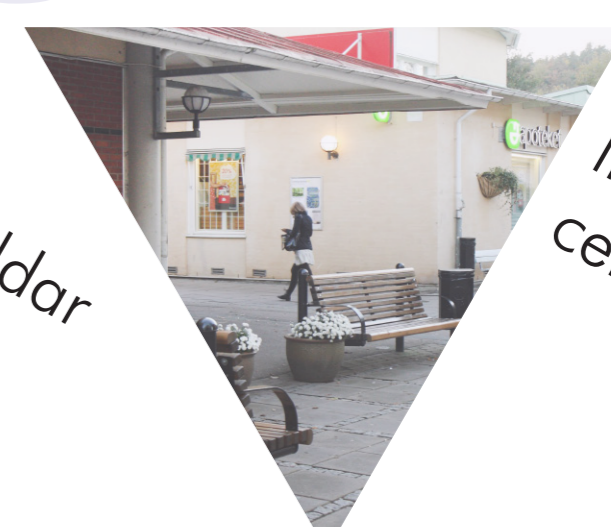
"Centrum" ligger inte i centrum