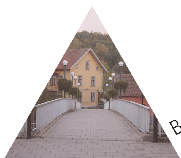
Broar över vattnet