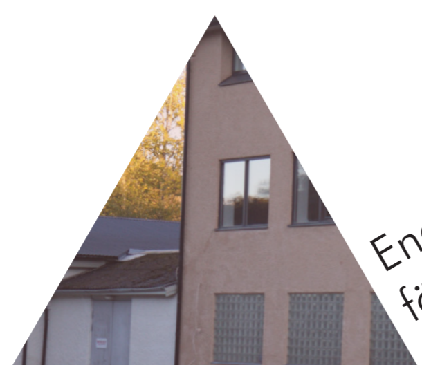
Engagerade företagare och Garveriet