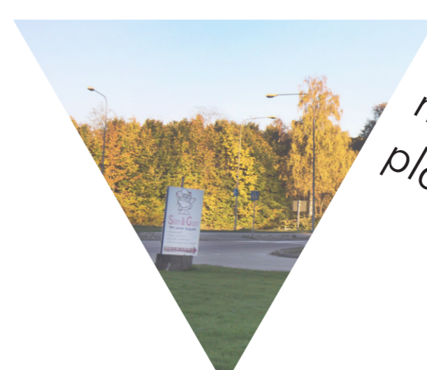
Dålig kontakt mellan attraktiva platser