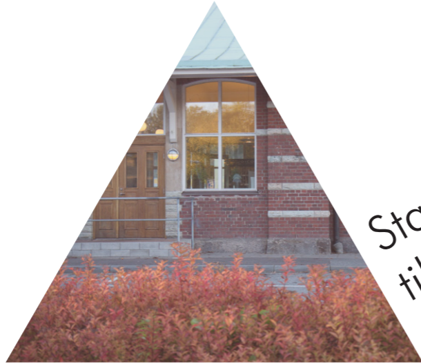
Stationen - närhet till Alingsås och Göteborg