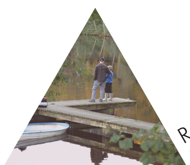
Rekreation och hälsa