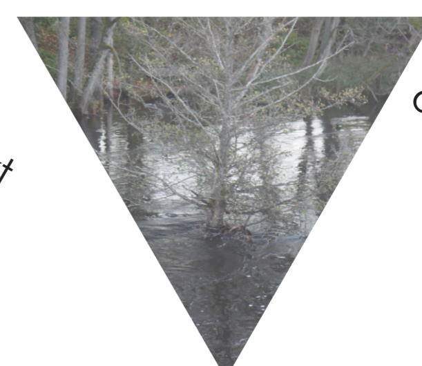
Risken för översvämning