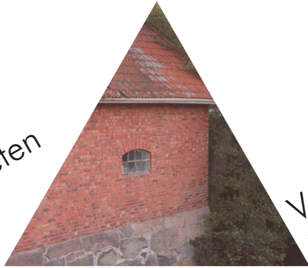
Vackra historiska byggnader