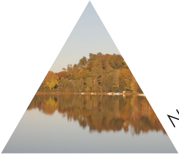
Närheten till naturen