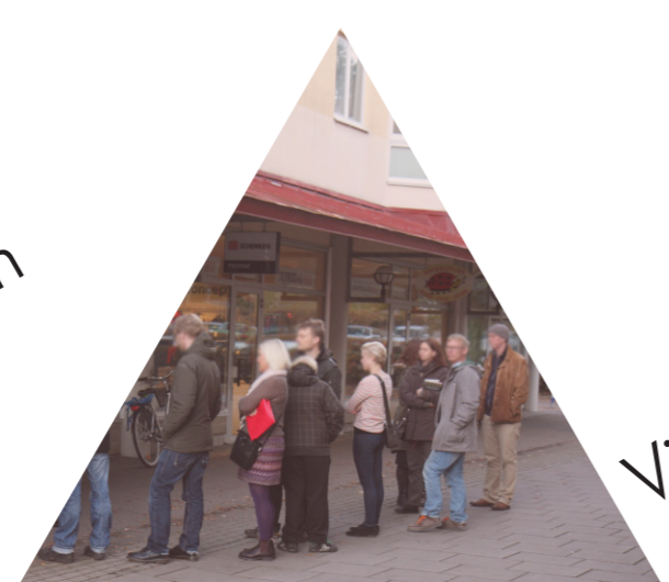
Viljan att köpa närproducerat