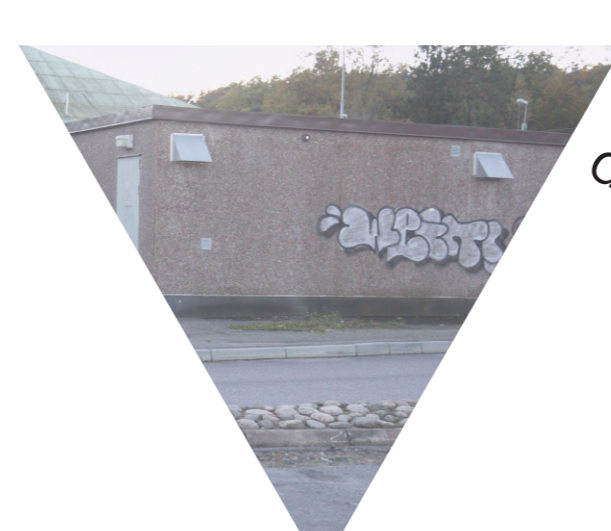
Stationsområdet är otryggt